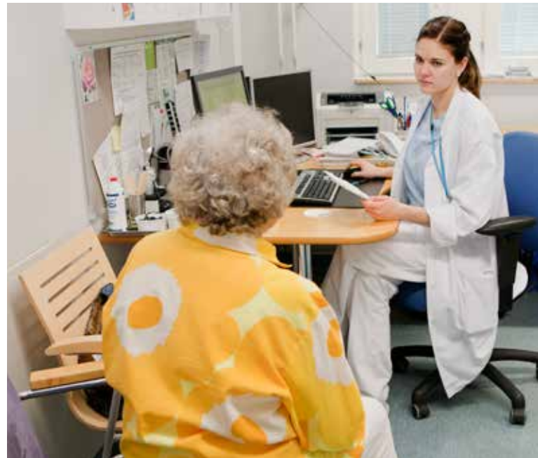
Terveystenhoito kuuluu kunnan tehtäviin.