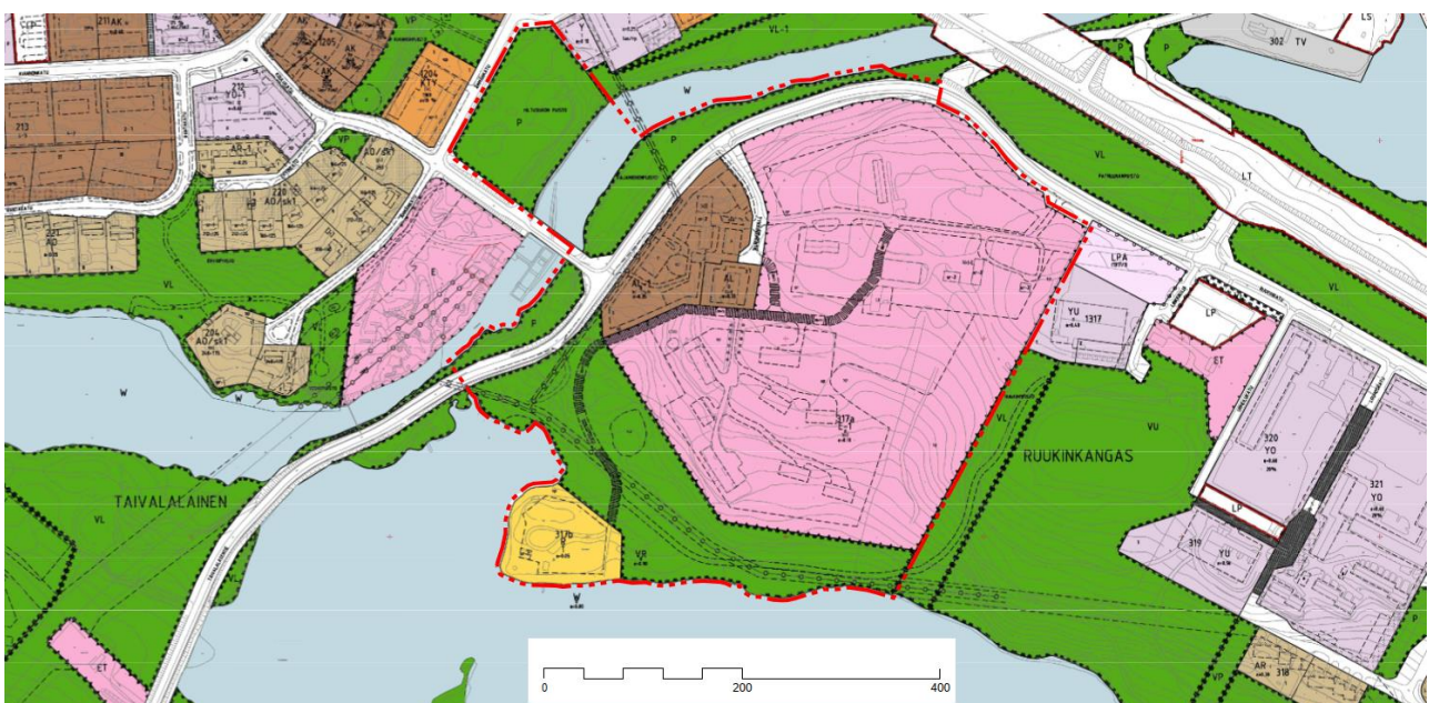
Ote Ämmänsaaren asemakaavayhdistelmästä. Asemakaavakartalla näkyy punaisella pistekatkoviivalla suunnittelualueen likimääräinen rajaus. (Suomussalmen kunta).

Suunnittelualue on Ämmänsaaren asemakaava-alueita.