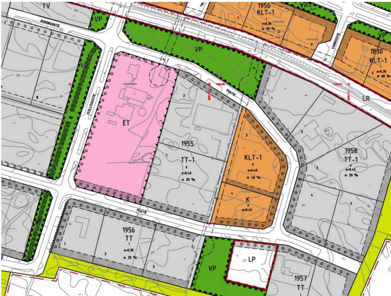
Ote Ämmänsaaren asemakaavayhdistelmästä. (Suomussalmen kunta).